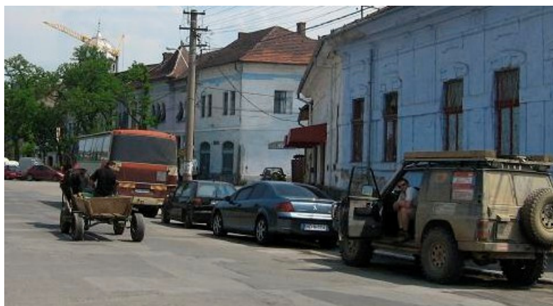
Die Nähe zur Zivilisation ist am Ende des Korridors bemerkbar.

Das gemeinsame Lagerleben hat durchaus seinen Reiz, man kann bequem plaudern und kucken, was so passiert. Hinter ein paar Hecken am Hang ist plötzlich Hundegebell zu hören, das immer lauter wird. Etwas weiter oben ist eine einfache Hütte und eine Schafherde, offenbar rotten sich alle Hütehunde gerade zusammen, irgendwas hat sie verärgert. Nach einigen Minuten wird der Grund sichtbar, ein leicht verunsichert wirkender Trophyteilnehmer erscheint hinter den Büschen und tritt vorsichtig den Rückzug Richtung Camp an, umringt von einer kläffenden Meute aus mindestens 10 Hunden. Ab sofort wird nur noch das extra improvisierte Häuschen benutzt, klarer Punktsieg für die rumänischen Hunde.